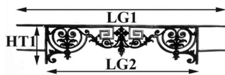
Diagrama explicativo dimensional