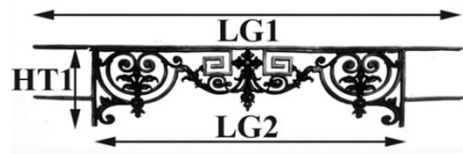
Diagrama explicativo dimensional