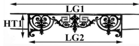
Diagrama explicativo dimensional