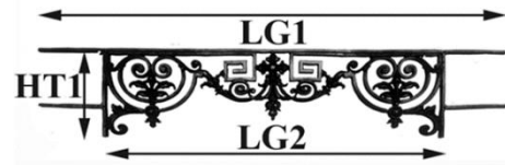
Diagrama explicativo dimensional