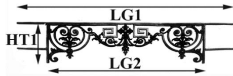
Diagrama explicativo dimensional