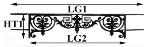
Diagrama explicativo dimensional