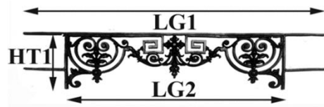
Diagrama explicativo dimensional