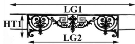
Diagrama explicativo dimensional