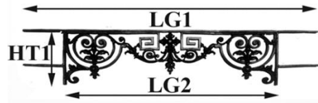
Diagrama explicativo dimensional