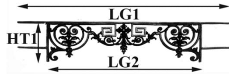
Diagrama explicativo dimensional