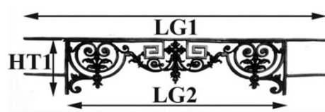
Schéma explicatif dimensionnel